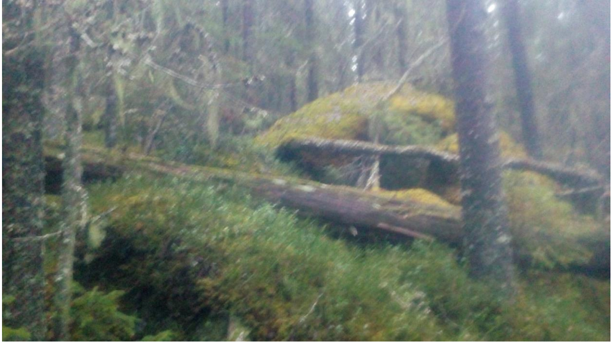
Ytterligare miljöbild – grov död ved.