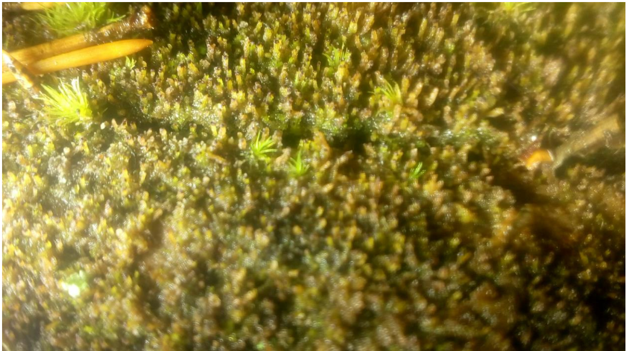
Mattor med vedtrappmossa (NT).