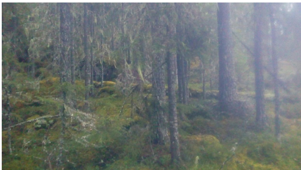
Miljöbild – naturskog.