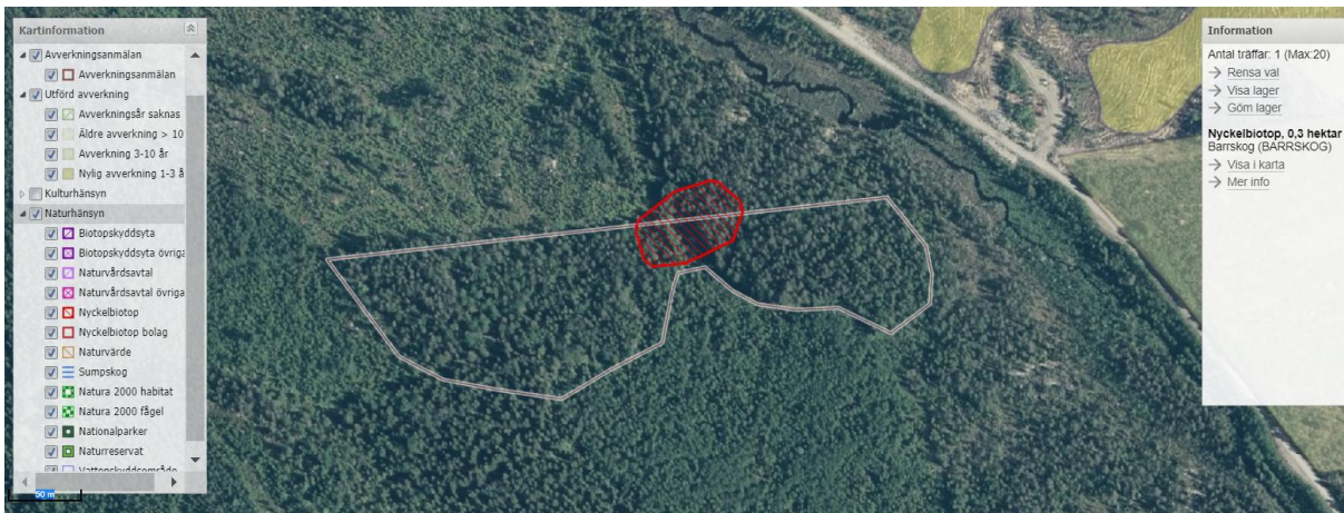
Vit avgränsning är den avverkningssannmälda skogen. Röd avgränsning är den registrerade nyckelbiotopen.