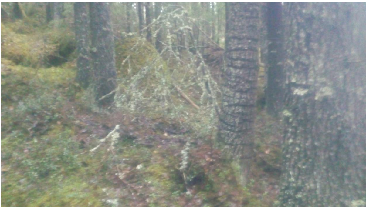
Ringhack av tretåig hackspett (NT) i den blockrika slänten.