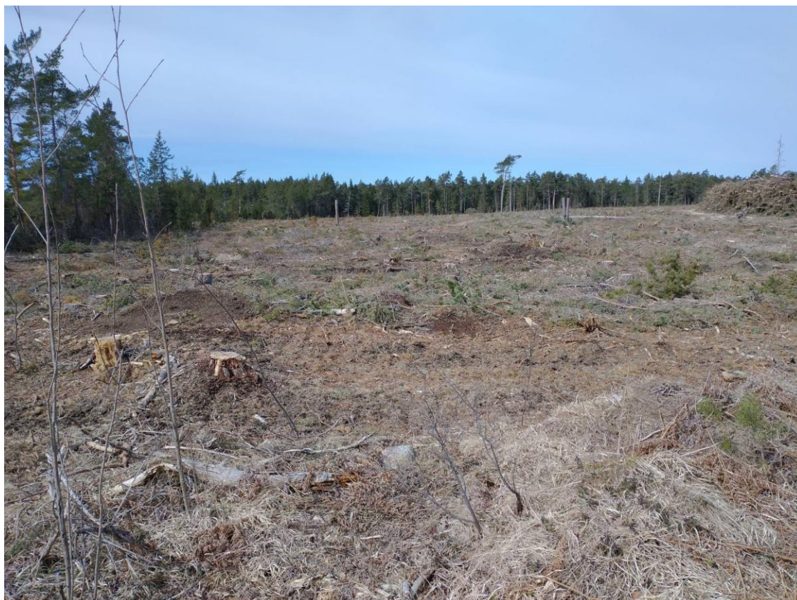
Foto på ytan om ca 1,6 ha som avverkats väster om avverkningsanmälan A5783-2018