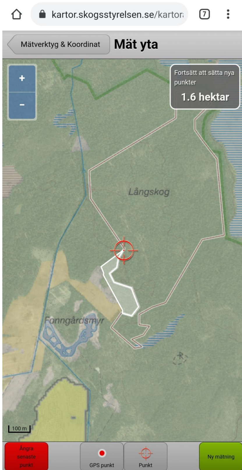
Inmätt yta på cirka 1,6 ha som avverkats väster om avverkningsanmälan A 5783-2018