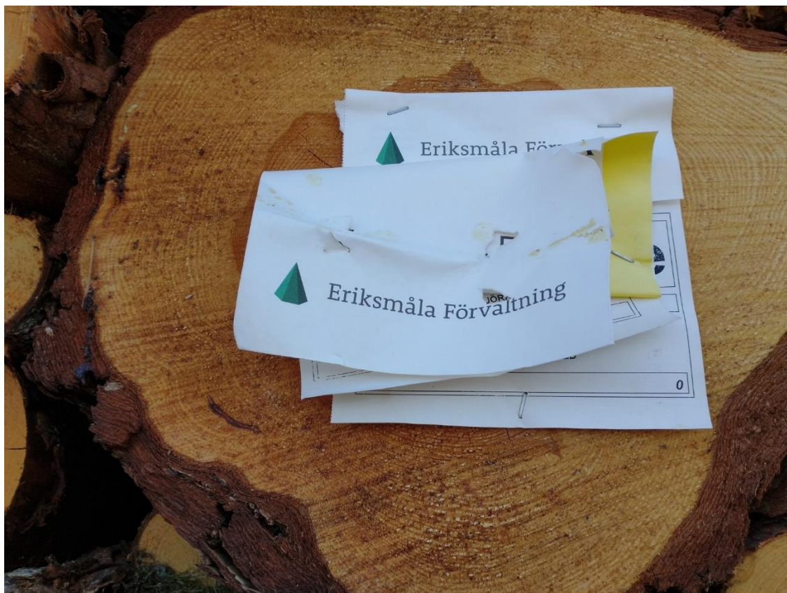
Märkning på det avverkade timret