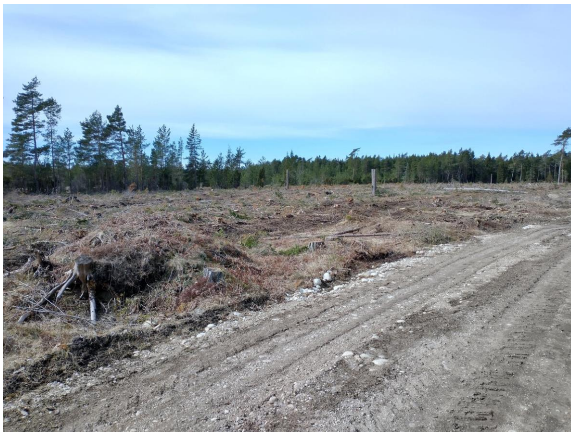
Foto på ytan om ca 1,6 ha som avverkats väster om avverkningsanmälan A5783-2018