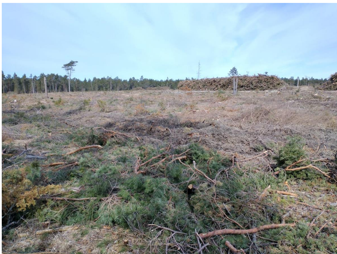
Foto på ytan om ca 1,6 ha som avverkats väster om avverkningsanmälan A5783-2018