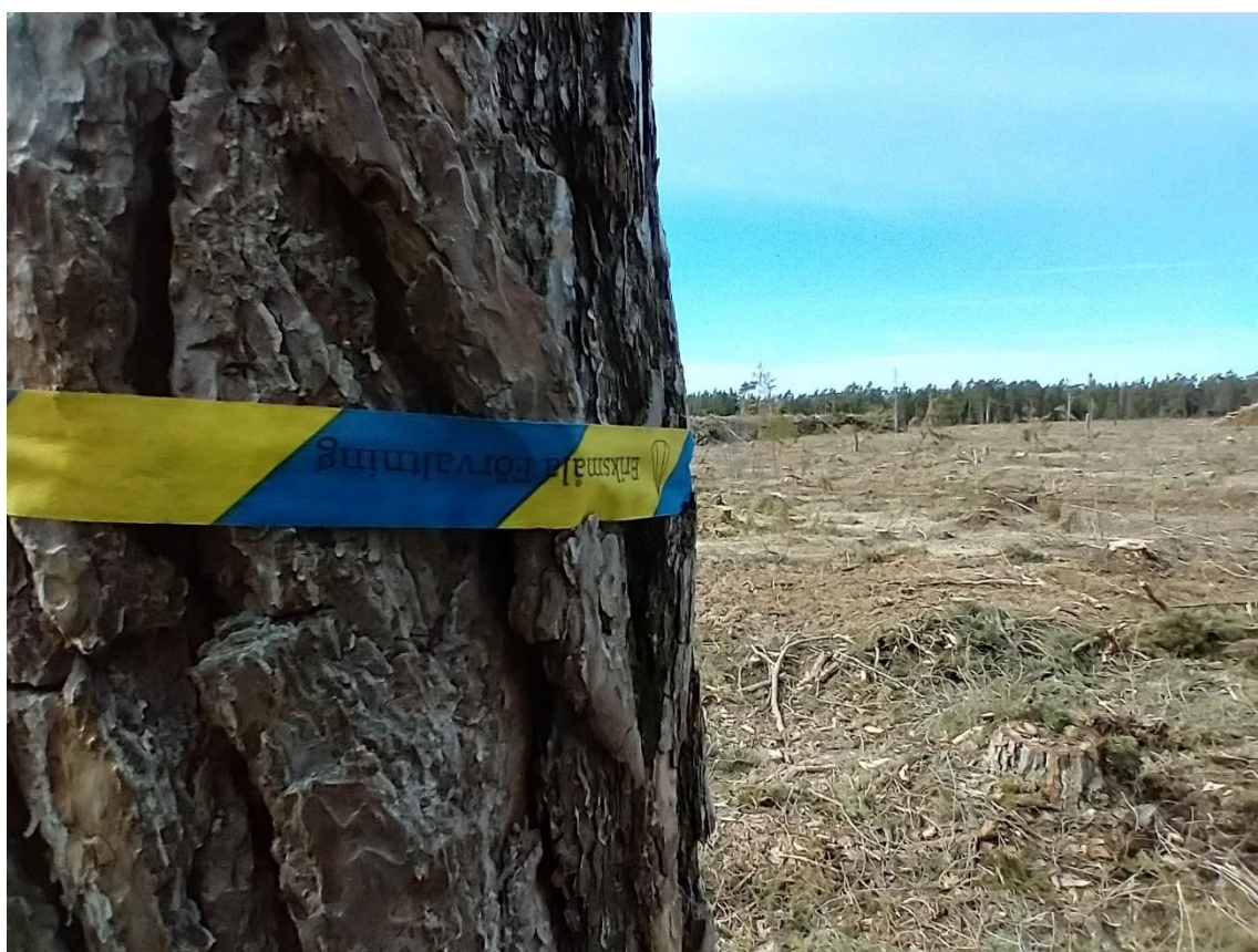
Foto på ytan om ca 0,6 ha som avverkats öster om avverkningsanmälan A5783-2018