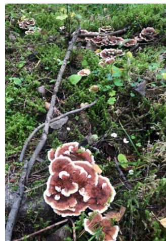
Orange taggsvamp, Vamby.