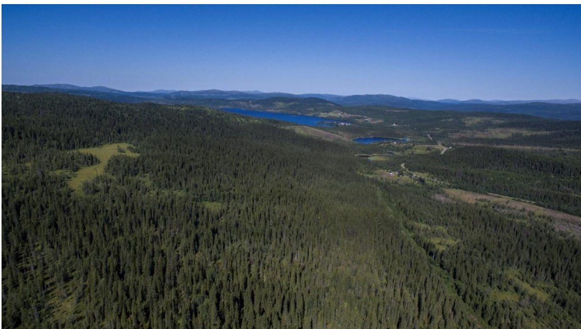
Figur 2. Flygbild över Björkvattsån-Björkvattsruet, mot Björkvattnet.

I byn Björkvattnet finns vandrarhem och vägarna leder vidare in i Norge vilket torde göra området attraktivt för naturturism. Att besöka Björkvattnets skogar i juli, när stormhatt och torta står i blom är en sällsam upplevelse. För den som är intresserad av orkidéer eller fågelskådning är detta en utmärkt plats att utforska. För besökare är det lätt att stanna bilen utmed någon av vägarna och bara promenera in i de gamla naturskogarna.